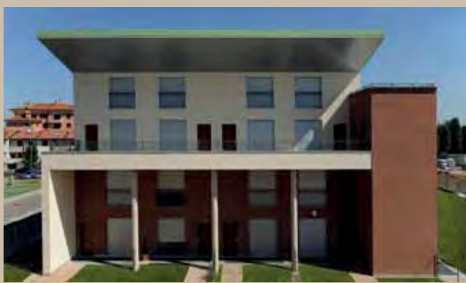
Fronte principale di uno degli edifici

La forma delle coperture è stata studiata ed ottimizzata per minimizzare i carichi termici e favorire, attraverso la realizzazione di ampi aggetti, un'adeguata ombreggiatura estiva delle facciate esposte a sud, senza però penalizzare l'irraggiamento nella stagione invernale. Il controllo attivo dell'edificio (realizzato con lo sfruttamento di materiali massivi, forma e caratteristiche climatiche) permette un risparmio energetico per l'utente migliorando, allo stesso tempo, le condizioni di comfort termo-igrometrico e acustico.