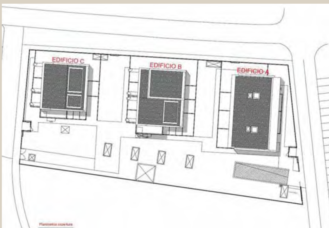
La planimetria delle coperture