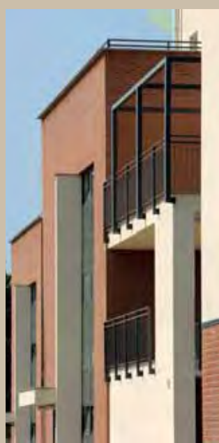
Particolare del fronte laterale

Strategie distributive e di orientamento. Dal punto di vista distributivo, il posizionamento ed il numero dei vani scala sono stati scelti in relazione anche all'orientamento delle singole unità abitative. Lo schema planivolumetrico dei tre edifici, orientati a sud, ne garantisce il corretto distanziamento degli edifici senza generare ombre portate tra i fabbricati (fattori di riduzione di illuminazione e soleggiamento) e favorendo la libera circolazione dei venti dominanti, evitando la formazione di perturbazioni di masse d'aria e vortici. All'interno delle stesse unità abitative, per tutti i soggiorni, è stato assicurato l'affaccio a sud, mentre i locali di servizio sono stati posizionati a nord.